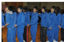
フォークダンス当日 出発前日の練習