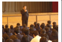
私立高校受験に向けて校長先生から激励の言葉が贈られました。