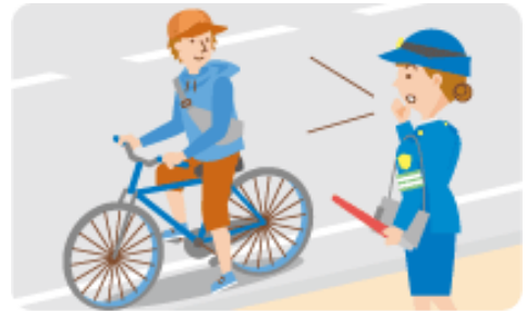
ブレーキのない自転車に乗ってはいけません!

警察官は、基準に適合するブレーキを備えていないため交通の危険を生じさせるおそれがあると認められる自転車が通行しているときは、停止させてブレーキを検査できるようになりました。さらに危険を防止するために必要な応急措置を命じ、応急措置では必要な整備ができない場合は、その自転車を運転しないよう命じることができるようになりました。